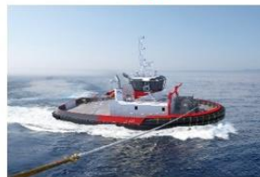
OST 32 E