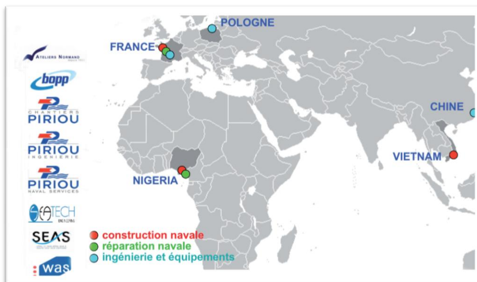
8 sociétés dans le monde : un déploiement stratégique

Basé à Concarneau (29), le groupe s'est implanté à l'étranger au plus près des zones d'activités, où il propose ses services aux armateurs publics et privés, civils et militaires, exploitant des navires de taille moyenne jusqu'à 120 mètres environ.